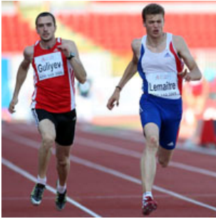
Christophe Lemaitre 100m - 10''04