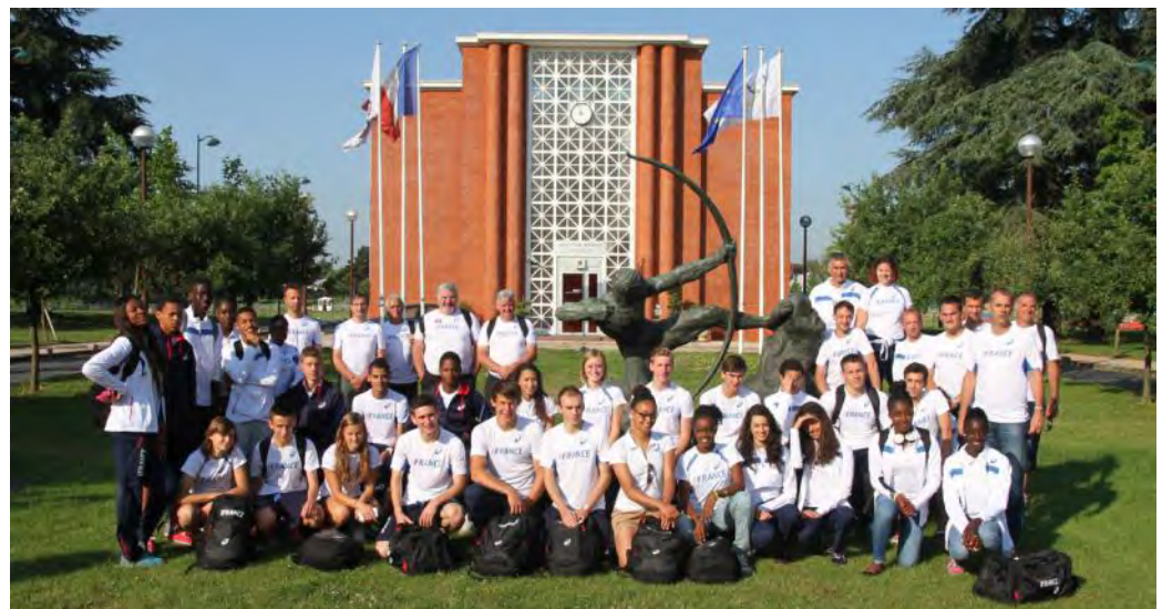
L'Equipe des moins de 18 ans s'est préparée à l'INSEP à côté de leurs aînés.