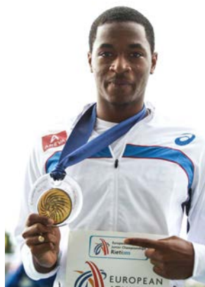
Wilhem BELOCIAN 110m haies 13"18 Champion d'Europe Record d'Europe Junior