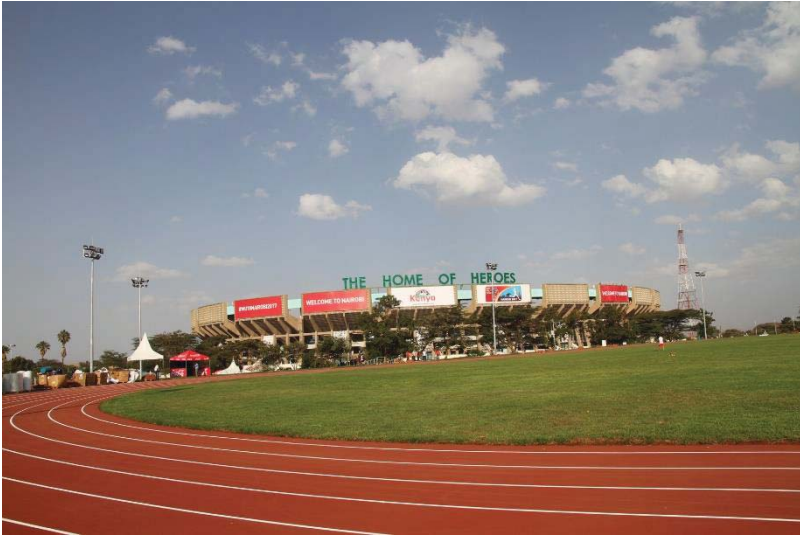
Le stade d'échauffement flambant neuf