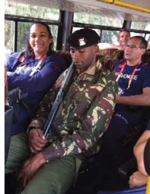
Comité d'accueil et garde rapprochée.