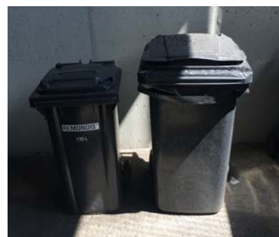
Les bains froids