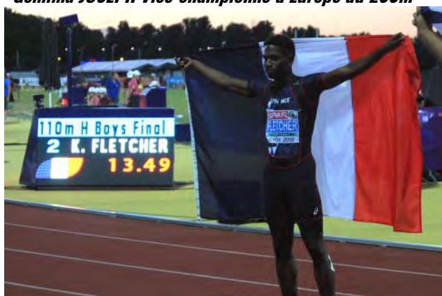
À gauche: Kenny Fletcher Vice-champion d'Europe du 110mH