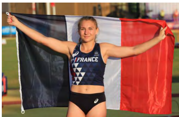
Emma BRENTEL Vice-championne d'Europe du saut à la perche