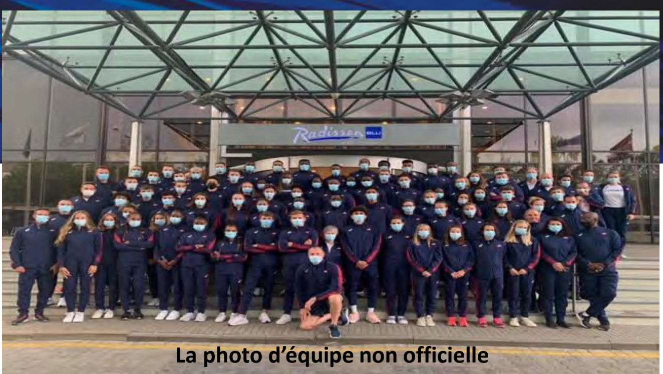
La photo d'équipe non officielle