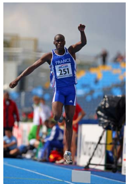
Teddy TAMGHO 16m30