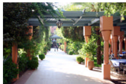
Les allées entre les bâtiments

Nourriture « européenne » au restaurant : buffet de crudités, plusieurs plats chauds et un ou deux desserts au choix.