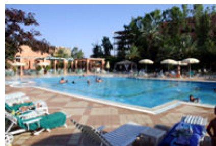
La piscine de l'hôtel