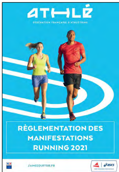
La réglementation des manifestations