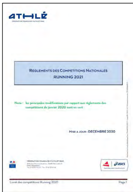
Le livret des règlements running