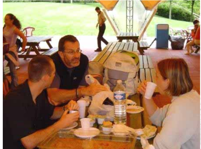
Ca discute... ca discute !